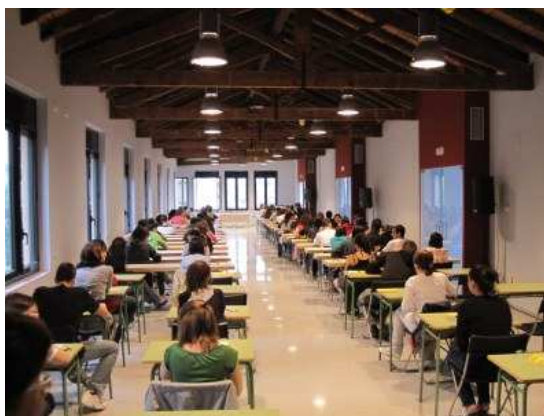
La Seu d'Urgell, 30 de juny de 2016

La millor puntuació de les PAU a l'Institut Joan Brudieu ha estat de 9,200 , mentre que a Catalunya ha estat de 9,800 (a Lleida, de 9,500 ). En total, a Catalunya hi ha hagut 420 estudiants, 248 noies i 172 nois, que han obtingut una nota igual o superior a 9 (543 l'any 2015), entre d'ells 4 alumnes noies de l'Institut Joan Brudieu. Aquests joves rebran les distincions que atorga el Govern de la Generalitat als estudiants amb millor nota en l'acte de lliurament que tindrà lloc el proper 18 de juliol a Barcelona.